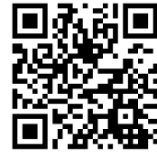
申込用 QR コード